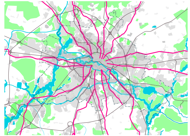
Übersichtskarte der Radialstraßen

Es ist die Ebene der Stadtregion, auf der sich die drängenden Themen der Zeit wie Klimaschutz und -anpassung, verträgliche Mobilität, soziale Spaltungen, demografischer Wandel, wirtschaftliche Transformation abbilden. Etwa zwei Drittel aller Berliner leben außerhalb der Innenstadt, im Speckgürtel wohnen fast noch einmal so viele Menschen wie in der Innenstadt. Diese Bereiche sind für die zukünftige nachhaltige Entwicklung Berlins